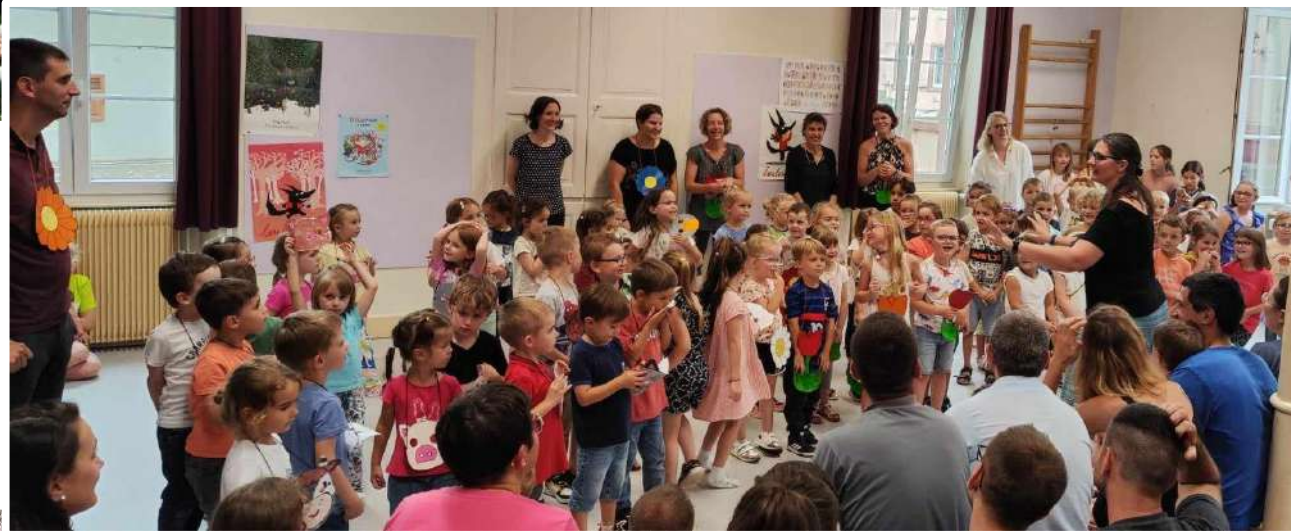
Chants : pas de kermesse cette année pour cause de pluie. Mais nous avons quand même présenté nos chants aux parents.