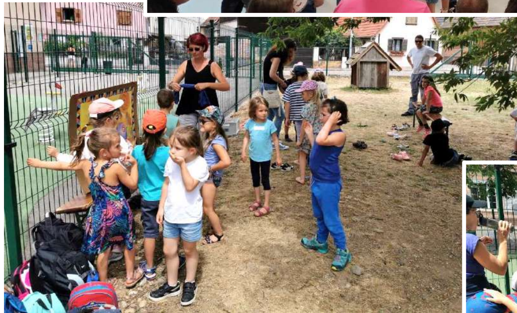
Rencontre avec les copains : L'école d'Oberentzen est venue nous rendre visite. Après le pique-nique, nous avons passé l'après-midi à jouer ensemble (queue de l'âne, sentier pieds nus, basket...). Un super moment !