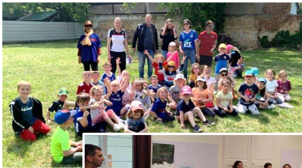
Intervention foot : initiation foot pour les grands de l'école. Différents jeux et même quelques matchs.