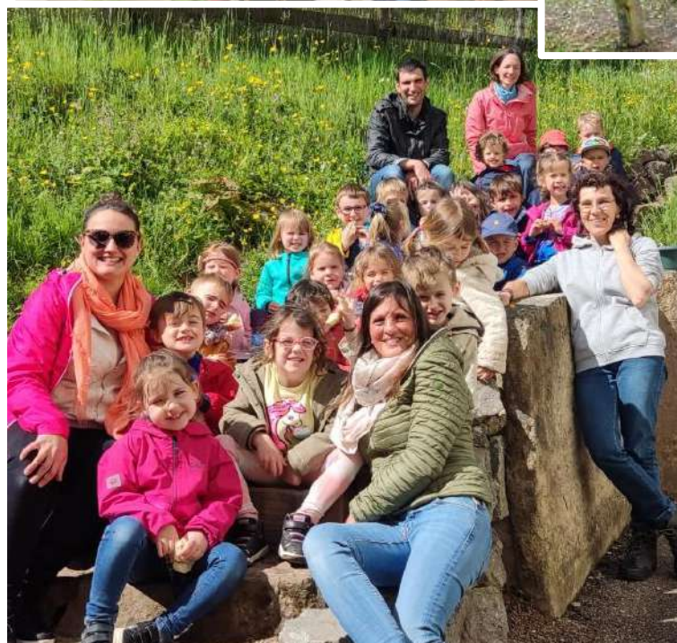
Classe de découverte : les classes bilingues sont parties passer deux jours au centre la Roche. Une expérience très enrichissante et de chouettes moments !