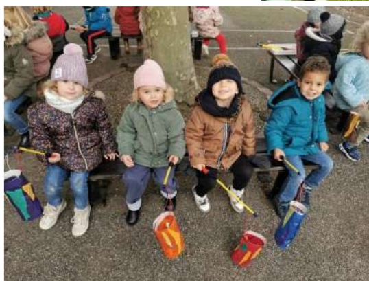
Saint Martin : Les traditions allemandes sont respectées avec le défilé des lanternes de Saint Martin.