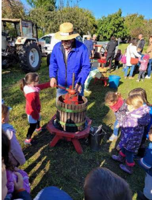
Les moyens et les grands sont allés au verger communal pour découvrir comment fabriquer du jus de pommes.