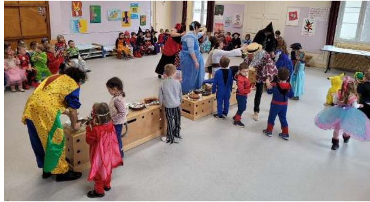
Carnaval : un super moment entre les classes pour fêter carnaval... Chacun avait trouvé un super déguisement... et nous avons dégusté de très bons gâteaux !