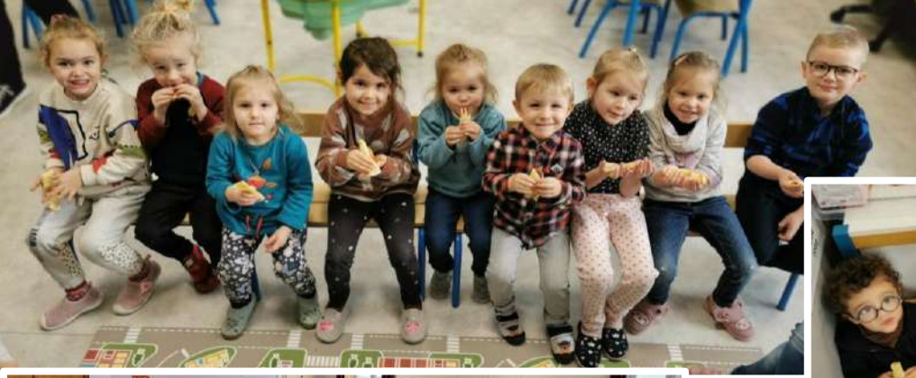
La chandeleur : vive les crêpes... au sucre... à la confiture ou au nutella ! un régal !