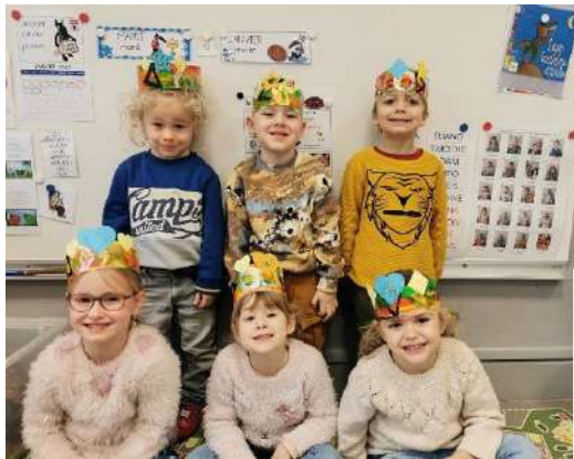
Galette : des reines et des rois... de jolies couronnes mais surtout de succulentes galettes préparées par les élèves