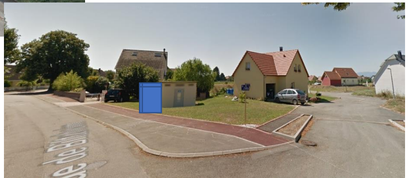
Angle Rues de Biltzheim et du Capitaine Michel Mann