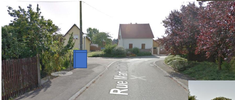
Rue Martin Drolling