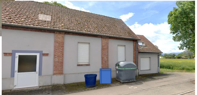
Rue de Rouffach, salle des fêtes