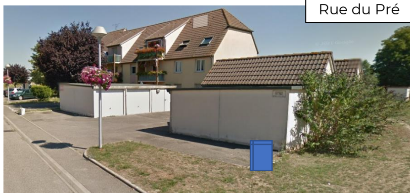
Rue du Pré

Les 6 abris bacs destinés à recevoir vos biodéchets seront installés le 3 janvier 2023 aux emplacements suivants :